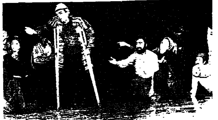
لقطة من مسرحية « شربل » في الكازينو